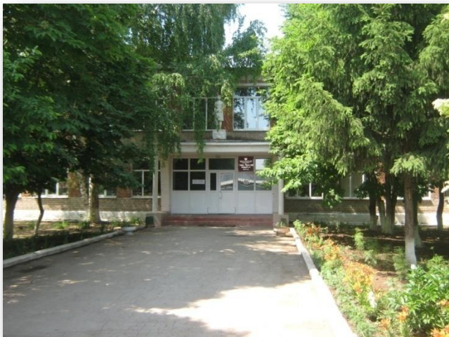
Кинель-Черкасский филиал (имеется общежитие)