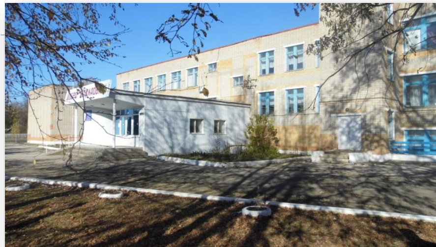
Шенталинский филиал (общежития нет)

Самарская область, Шенталинский район, ст. Шентала